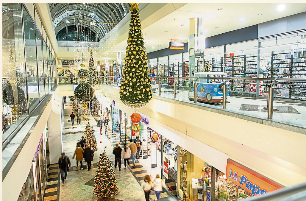
Mit viel Liebe zum Detail hat das Centermanagement die Shopping Arkaden weihnachtlich eingerichtet.

Das Angebot der Gastronomen und Dienstleister unterstreicht den Erlebnischarakter in den Shopping Arkaden ebenso. Es gibt einen Bäcker und einen Asiaten, einen Mittagstisch-Anbieter und ein Eiscafé, einen Friseursalon und ein Nagelstudio. Zum etwas längeren Verweilen lädt das Café und Restaurant im