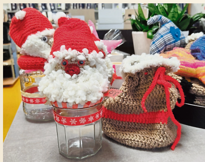
In der „Bastelecke“ in den Räumen des Werksverkaufs finden sich hübsche Geschenkideen, deren Erlöse gespendet werden.

Öffnungszeiten: Dienstag und Samstag, 9 bis 13 Uhr sowie Montag, Donnerstag und Freitag, 15 bis 19 Uhr. Heiligabend und Silvester ist geschlossen. Ansonsten ist der Fabrikverkauf zwischen diesen Feiertagen geöffnet